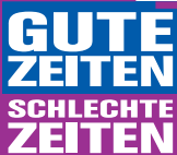
Foto Köster präsentiert in Kooperation mit NIKON und RTL exklusiv auf der Fotofachmesse_09 einen sehr bekannten Hauptdarsteller aus der RTL Soap Gute Zeiten Schlechte Zeiten und veranstaltet am Samstag, 28.11.2009 ab 14.00 Uhr eine Autogrammstunde . Evtl. Terminänderungen finden Sie unter www.foto-koester.de .

Gewinnen Sie eine Komparsenrolle in der TV-Serie GZSZ! Sie lassen sich einfach auf der Fotofachmesse_09 in einer von Nikon aufgebauten Kulisse möglichst cool fotografieren. Die erstellten Fotos werden inkl. Ihrer Adresse direkt online an Nikon geleitet und dort für die große Verlosung gesammelt. Wir sind gespannt, ob der neue TV-Star von GZSZ vielleicht aus dem Münsterland kommt ...